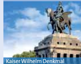
Kaiser Wilhelm Denkmal

Ab Cochem fahren Sie am besten bei Kaisersesch auf die A 48 Richtung Koblenz oder mit dem Regionalexpress ab Cochemer Bahnhof.