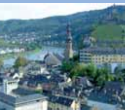
Blick auf Cochem

Moseltal. Der Name geht auf einen Schafhirten zurück, der eines seiner verirrtten Tiere, vor dem Absturz bewahren wollte und dabei selbst ums Leben kam. Ihm zu Gedenken wurde das Kreuz errichtet.