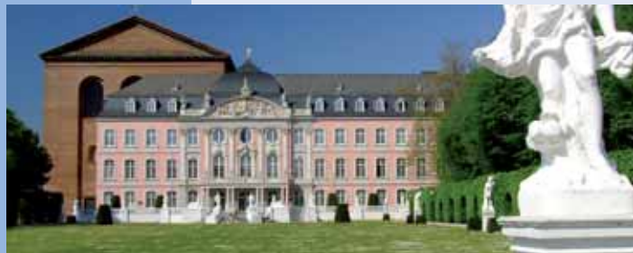
Kurfürstliches Palais und Konstantin Basilika

Ab Cochem fahren Sie am besten bei Ulmen auf die A 48 Richtung Trier oder mit dem Regionalexpress ab Cochemer Bahnhof.