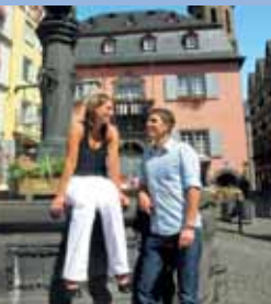
Marktplatz in Cochem