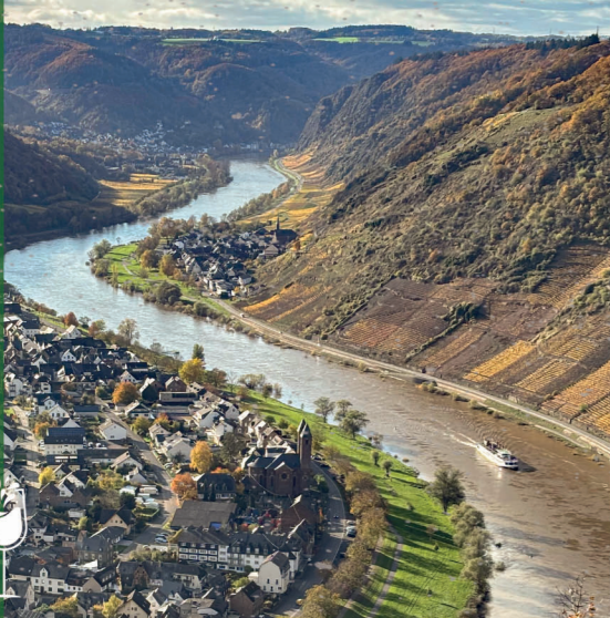
Die Orte unserer Winzer