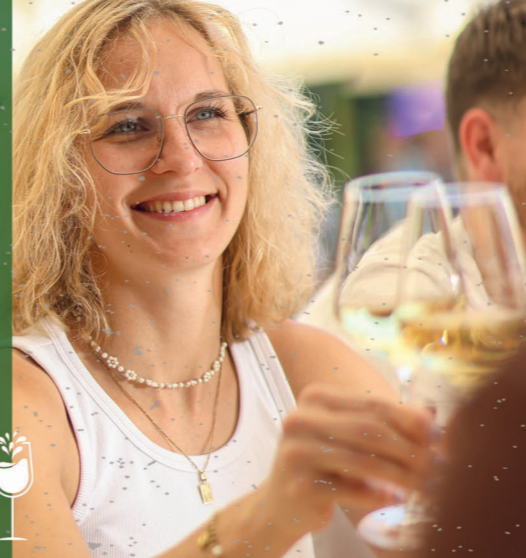
Moselweine Winzersekte Live-Musik Feuerwerk Majestäten