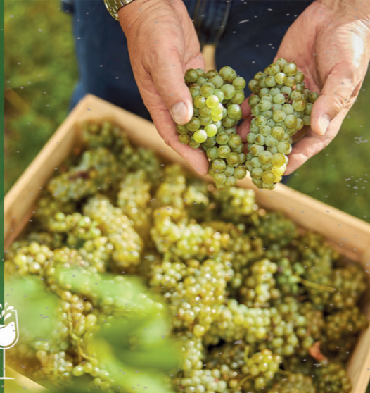
Das Programm der Mosel- Wein-Woche